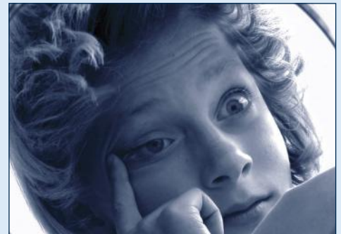
Kontaktlinse absetzen mit Lidzug-Methode