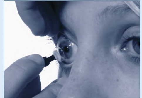
Kontaktlinse absetzen mit Sauger