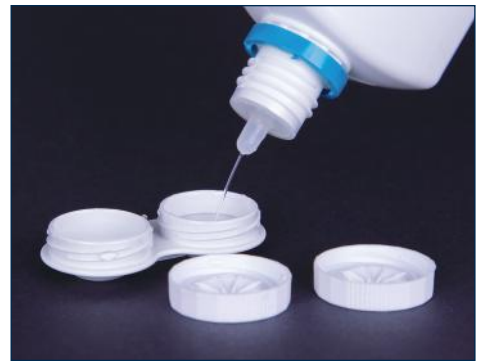
Auffüllen und Aufbewahren der Kontaktlinse