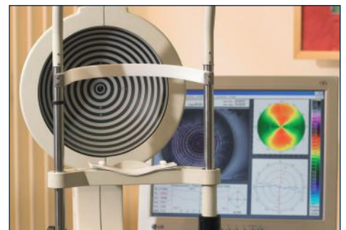
Modernes Hornhaut-Messgerät: Keratograph

Formstabile Kontaktlinsen halten auf den Augen ihre Form. Der Tränenfilm gleicht die Hornhautverkrümmung ganz von alleine aus. Damit sind formstabile Kontaktlinsen die einfachste und eleganteste Lösung, um eine Hornhautverkrümmung zu korrigieren.