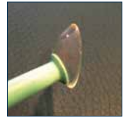
Sauger am Rand der Linse ansetzen