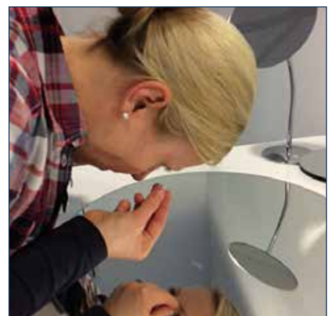
Einsetzen waagrecht über einem Tisch